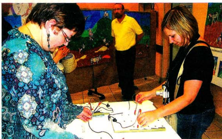
Devinette sur les objets recyclables ou pas. Même pour les adultes, ce n'est pas toujours facile d'y répondre.