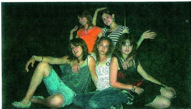
Les « anciennes » présenteront un enchaînement de textes, de Grand Corps Malade à Rimbaud.

Les élèves de l'atelier théâtre de l'association Traces et Cie présentent, demain, leur spectacle de fin d'année. Un atelier attractif : en quatre ans, les effectifs ont triplé.