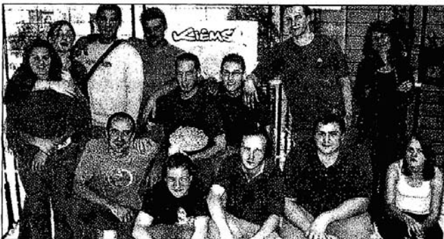
L'association Paye ton Son a organisé un concert, samedi soir, avec Kiemsa en tête d'affiche.

Rock, néo-métal, ou punk. Samedi soir, le centre culturel a vibré. Derrière ce festival de décibels, on trouve l'association Paye ton son. Rencontre avec ces amoureux de la musique, à l'œuvre depuis plus de six ans.