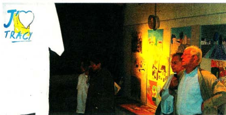
Les Traçotins ont déclaré leur flamme pour leur commune à l'occasion de l'exposition «J'aime Tracy».