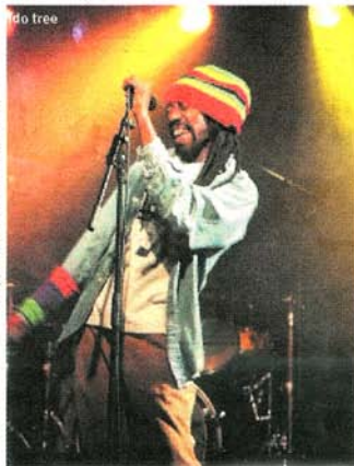
Deido Tree, groupe de reggae jamaïquain, d'envergure internationale, en scène à Thourotte.