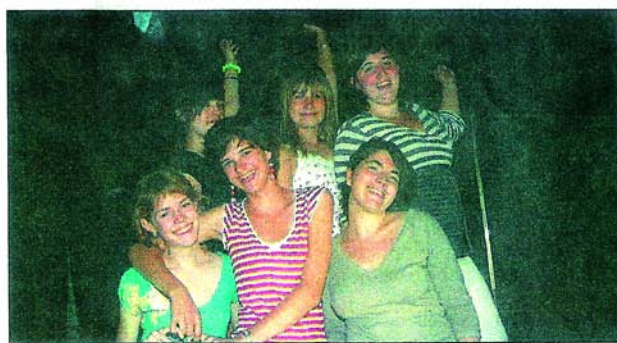
Les 13-14 ans joueront « C'est comme ça, c'est tout », l'histoire d'une famille bourgeoise en plein réveillon de Noël.

Elles avaient aussi envie de chanter, de danser... alors elles chanteront et danseront. Et le trac dans tout ça ? « Le théâtre nous aide à prendre de l'assurance et à lutter contre la timidité, alors le trac, à force de mon-