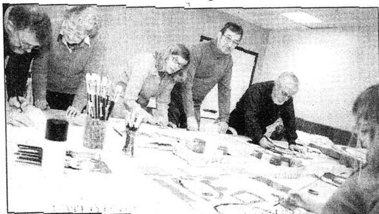
Le collectif d'artistes Peinturage et marouflage prépare une exposition, en juin, sur le thème de l'écologie.