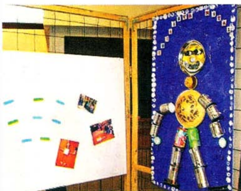
Avec un peu d'imagination, les anciens objets peuvent devenir de véritables œuvres d'art.