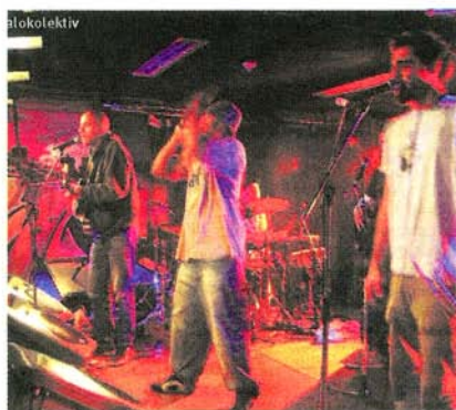
Dialokolektiv, du hip-hop jazz amiénois.